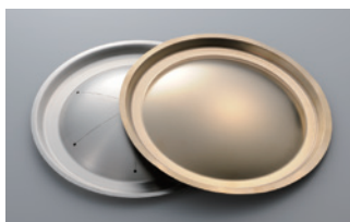
■ CV型 CV type