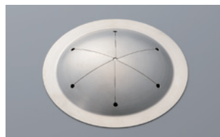
■ 開放型バキュームサポート Open-type Vacuum support