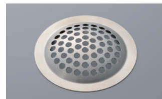
■ 永久型バキュームサポート Permanent-type Vacuum support