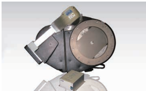
ペンドロールバルブ Penduroll valve