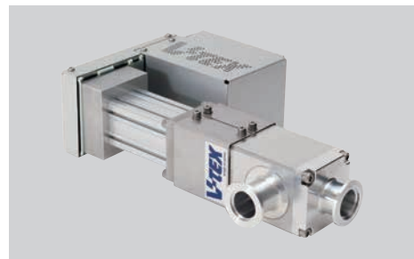
フローコントロールバルブ Flow controll valve